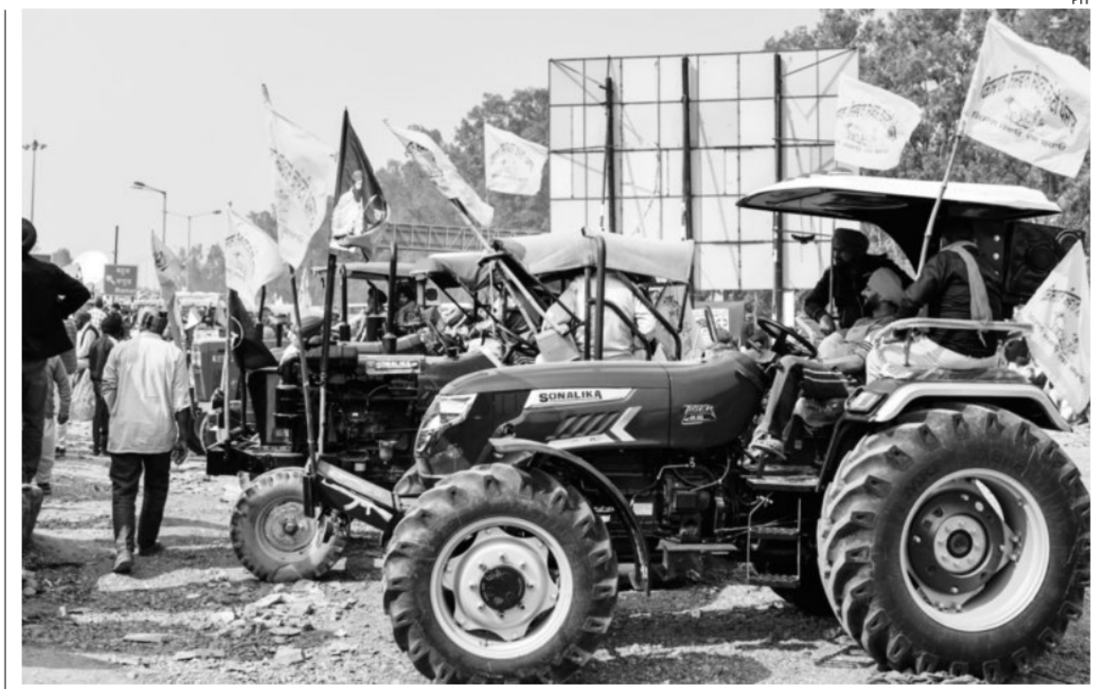
The agitating farmers await a resolution to their demand for legalising MSP. The protests have been paused till March 29

Is this offer then limited only to these states? If so, is it fair for pulse-growing states? In any case, there is a large and wellestablished system of procurement in states like Punjab for paddy and wheat, and unless such a procurement system is also evolved for other crops, merely legalising the MSP for a few crops will not help. Also, a system for orderly disposal of the proc-